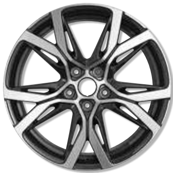
18"-Leichtmetallräder Sérac, glanzgedreht