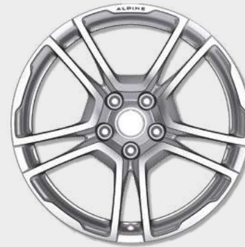
18"-Leichtmetallräder von Fuchs, geschmiedet