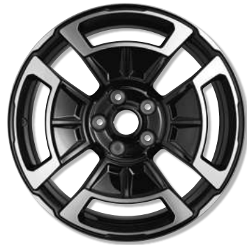
18"-Leichtmetallräder Légende, diamantschwarz lackiert und glanzgedreht