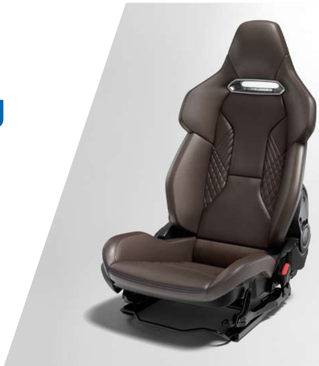
Sechsfach einstellbare Komfortsitze von Sabelt (erhältlich in braunem oder schwarzem Leder)