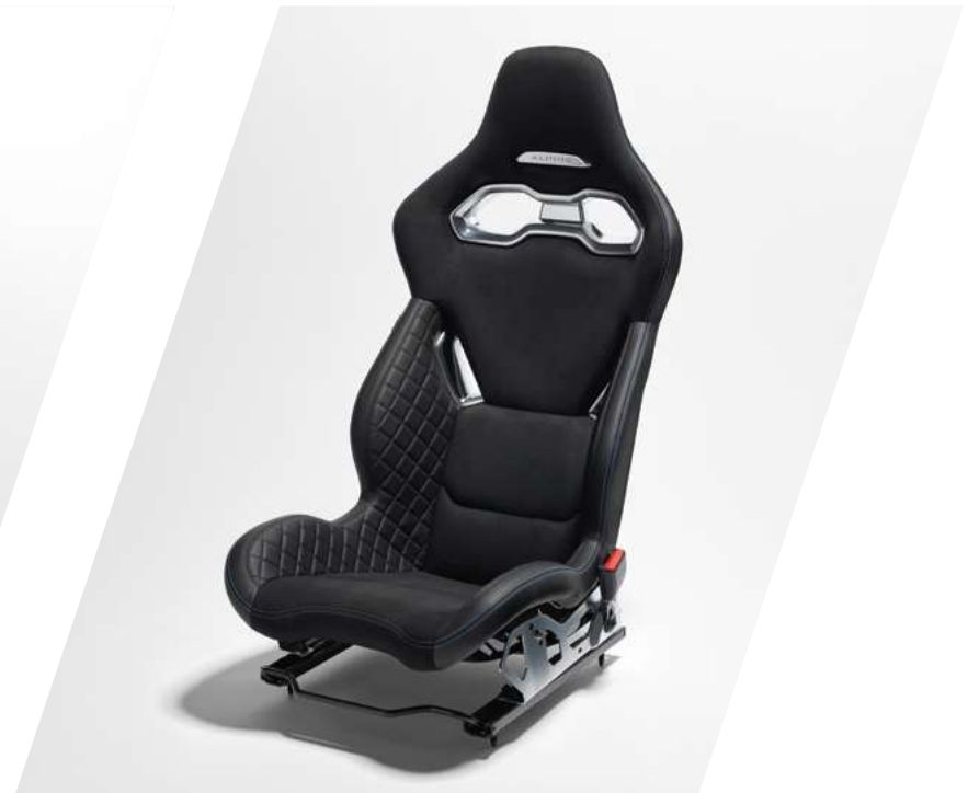
Leichte Sabelt-Rennsitze aus schwarzem Leder und Mikrofaser