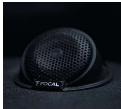
Zwei invertierte Kalottenhoctöner